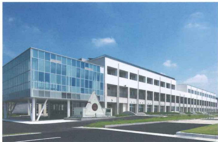
宇都宮工業高等学校

岩村建設は、あらゆる分野の知識を吸収し、時代を超える価値の高い建築を実現していきます。 「老いることのない建築」それが私たちの理想であり、変わらぬ使命であると考えます。