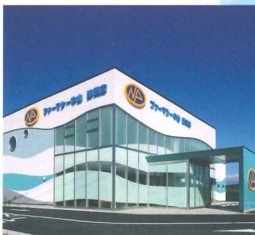
ファーマシー中山