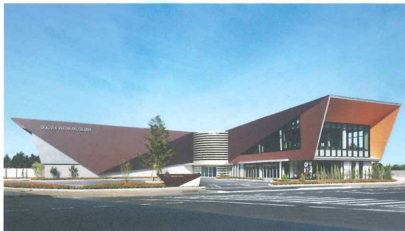
栃木セキスイハイムミュージアム