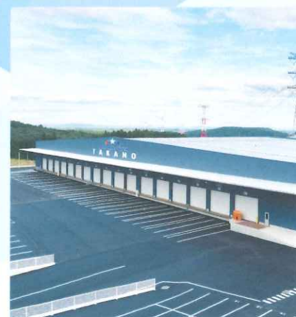
(株)高野商運 物流センター