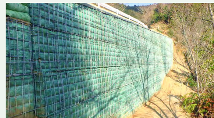
▶ 九千部災害復旧工事(鳥栖市)