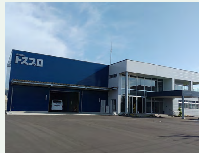
▶ 株式会社トスプロ