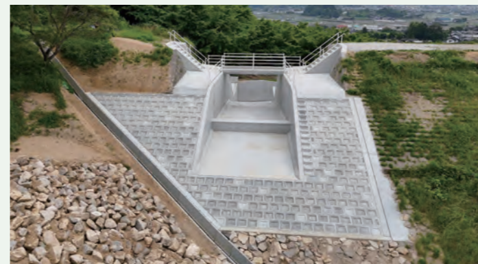
▶ 亀の甲地区県営ため池等整備事業工事