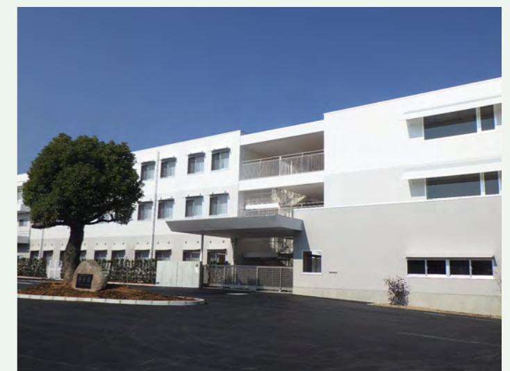
▶ 障害者支援施設青葉園