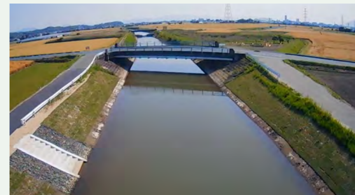
▶ 通瀬川河川整備交付金工事