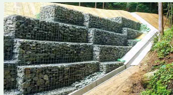
▶ 横井線災害復旧工事(鳥栖市)