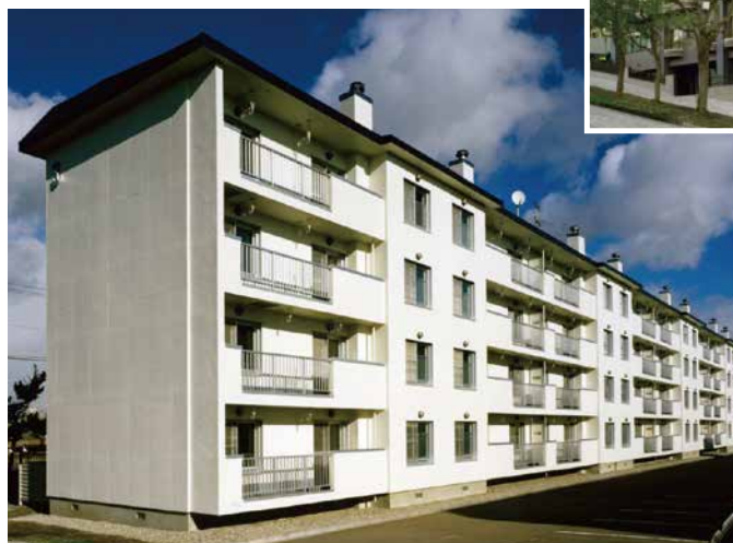
防衛施設局 函館広野町宿舍