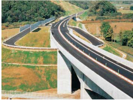
北海道縦貫自動車道 大成工事