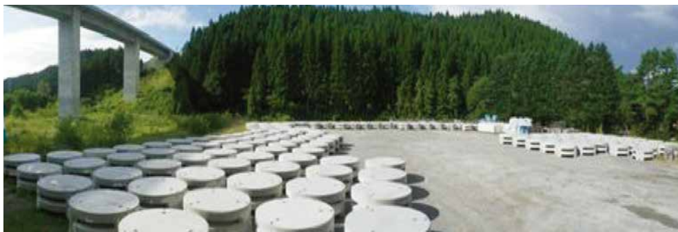
北海道津軽海峡地区北斗はまなす増殖場造成工事