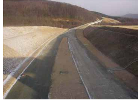
北海道横断自動車道西新得工事