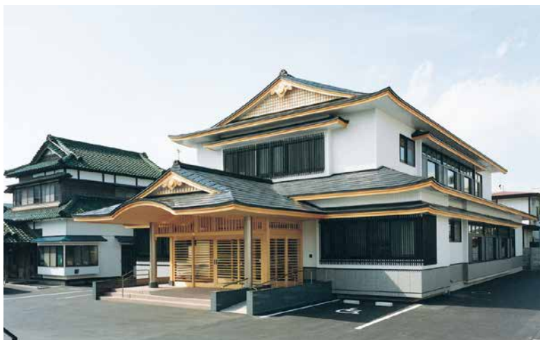
函館別院 本町支院・ 別院教化センター (函館市本町)