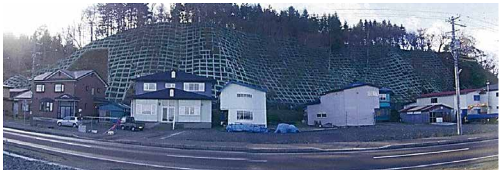
見日地区地域防災対策総合治山工事