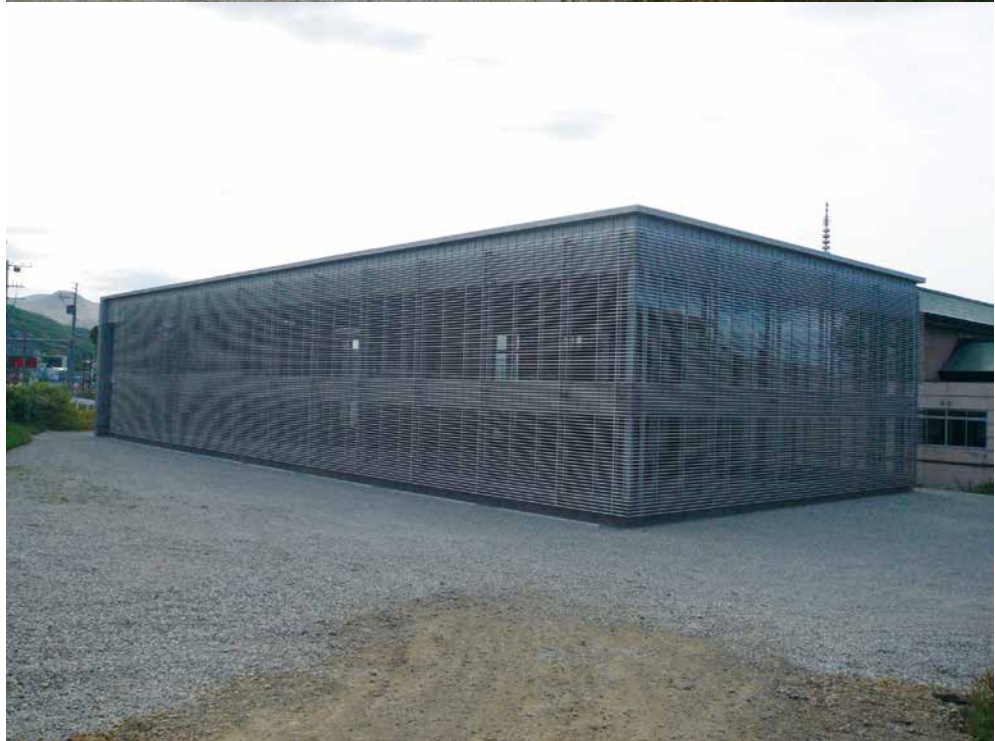
(宗) 祥龍寺 納骨堂 (札幌市)