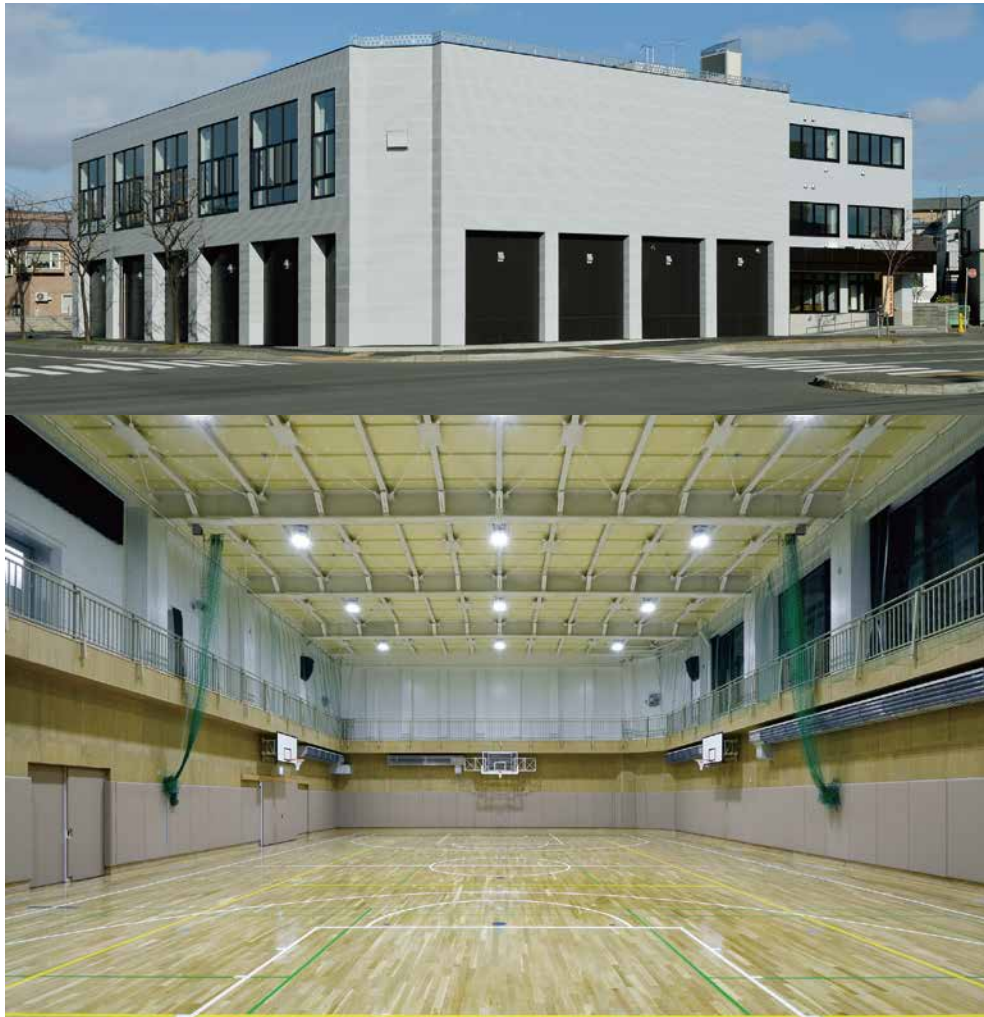
吉田学園 北海道体育大学校 体育館 (札幌市)