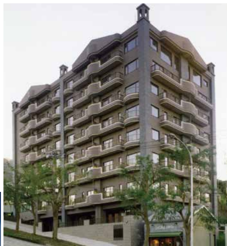
フォルム二十間坂 (函館市末広町)