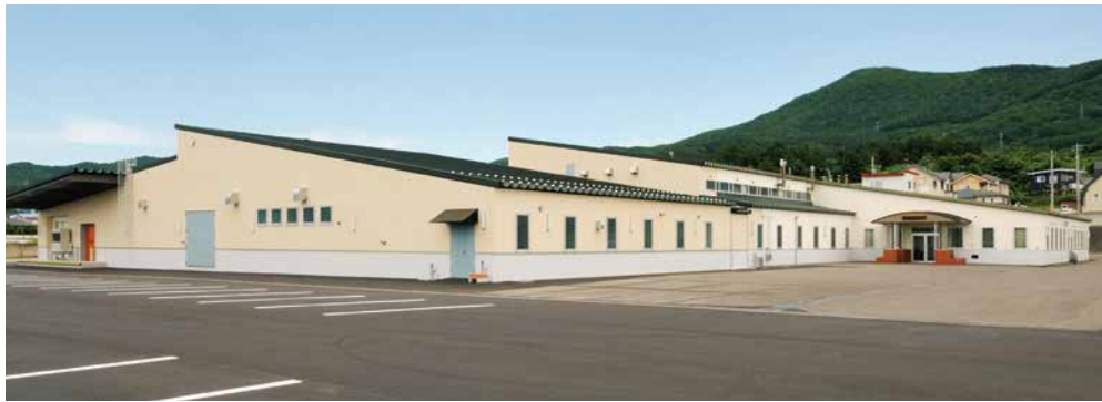
菊池食品工業(株)函館工場（七飯町）