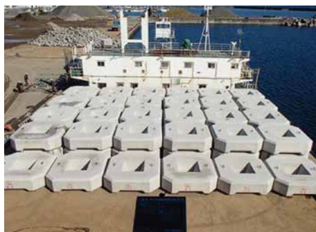
白老海岸竹浦地区災害復旧工事 1 工区