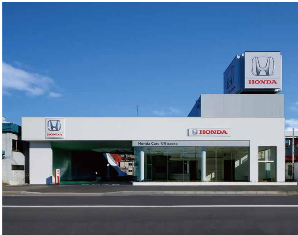
ホンダカーズ札幌 北38条店

一度、御覧になって頂ければ、その価値が、一様に均整のとれたものである事が御理解頂けるものと、自負しております。