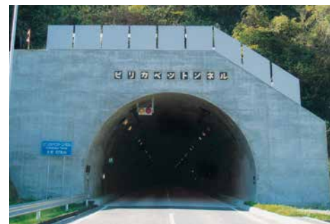
ピリカベツトンネル 一般国道277号八雲町鉛川トンネル工事 ■発注者/函館開発建設部 ■所在地/八雲町 ■竣工/平成15年