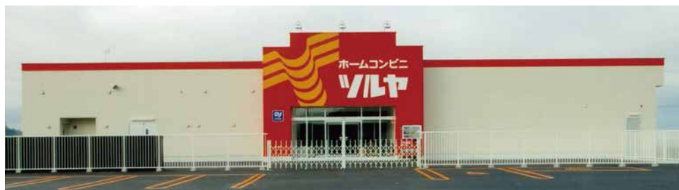
ホームコンビニ ツルヤ古平店