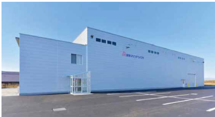
協栄マリンテクノロジー(株) 函館営業所（函館市港町）