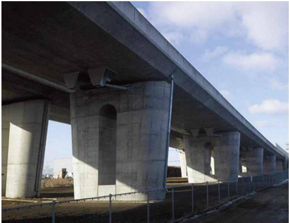
一般国道 228 号 函館市 桔梗高架橋耐震補強工事 ■発注者/函館開発建設部 ■所在地/函館市 ■竣工/平成27年