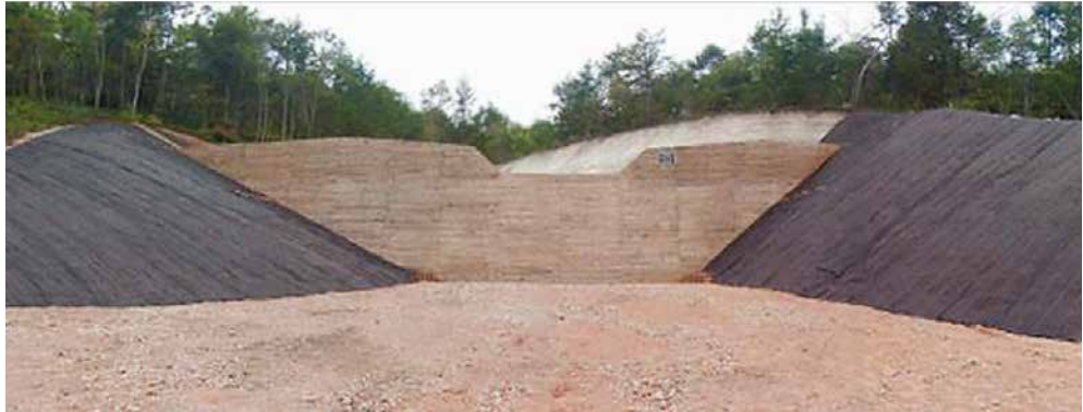
渡島森林管理署駒ヶ岳地区治山工事（留の沢右の沢） ■発注者/渡島森林管理署 ■所在地/鹿部町字本別 ■竣工/平成25年