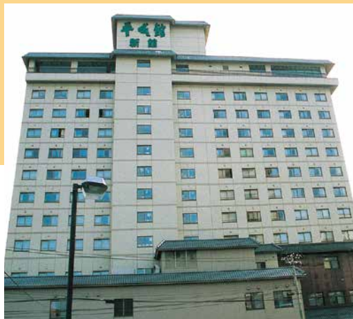
ホテル平成館（函館市湯川町）

それらを、踏まえ、当社ではホテル、旅館等の構築に携わってまいりました。お客様が、御利用になった後も、また「来たい（期待）」と思う施設を建設してまいりたいと心掛けております。