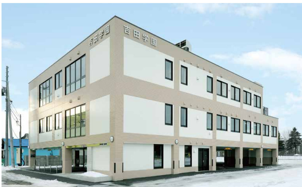
吉田学園 北海道自動車整備大学校学科棟 (札幌市)