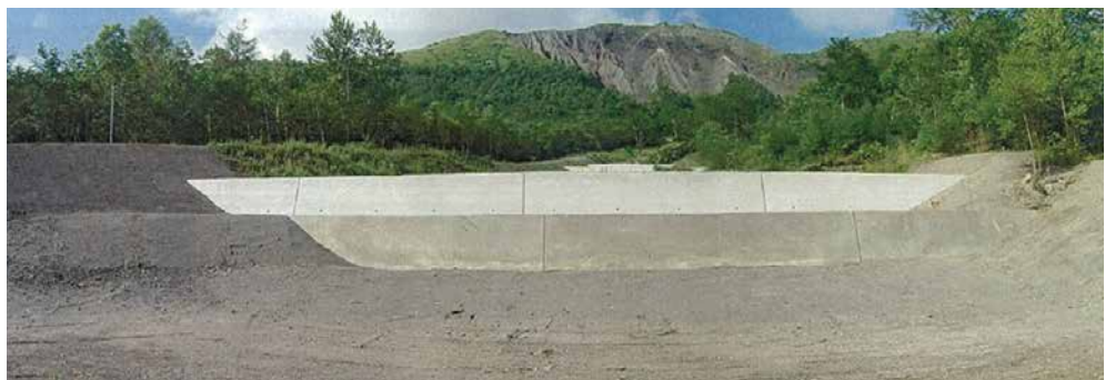
大平右の沢治山工事