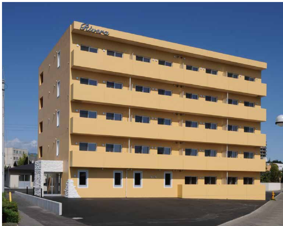
湯の川高齢者専用住宅及びデイサービス（函館市湯川町）

これまでの、ノウハウを生かしながら、今後の将来に向けた、多様性を検討しつつ、お客様のサポートができるような、施設建設を今後も、全社一丸となって、歩んでまいります。