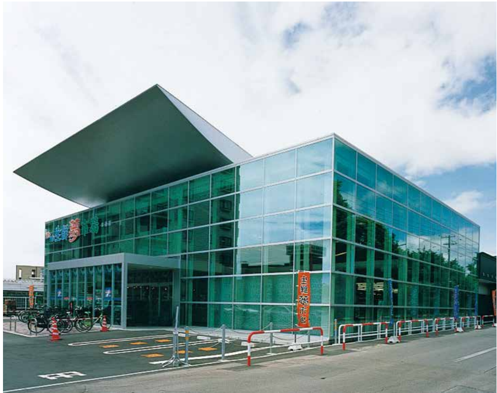
スーパー魚長 本通店 (函館市本通)