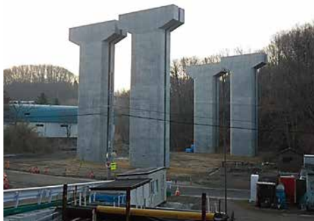
函館新外環状道路函館市東山大橋橋脚工事