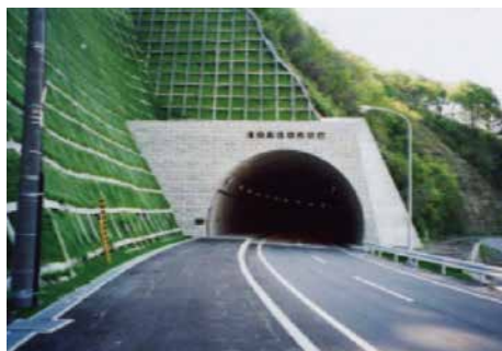
いさりびトンネル 小谷石渡島知内停車場改良工事1工区 ■発注者/北海道渡島支庁 ■所在地/知内町 ■竣工/平成14年