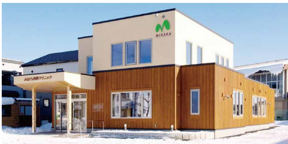
みはら内科クリニック (函館市本通)