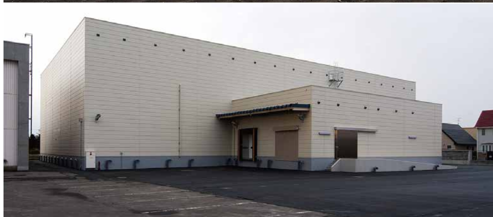
トナミ食品工業株式会社冷蔵庫（北斗市）