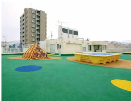
吉田学園 くりの木保育園 (札幌市)