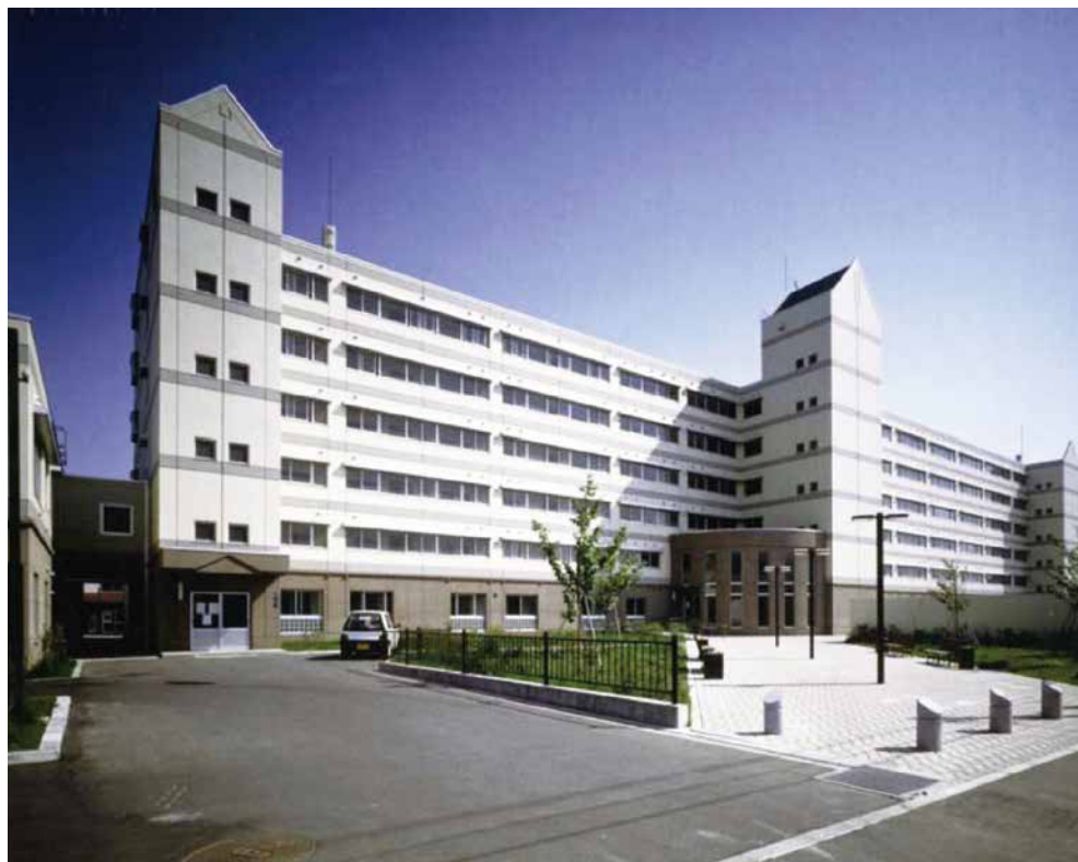
市営住宅港2丁目団地1号棟 (函館市港町)