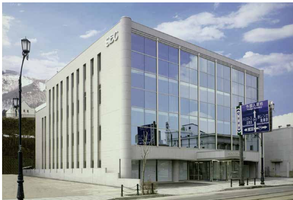
エスイーシー システムビル（函館市末広町）