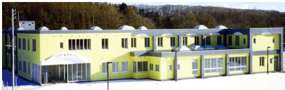
特別養護老人ホーム「ももハウス」(函館市赤川町)