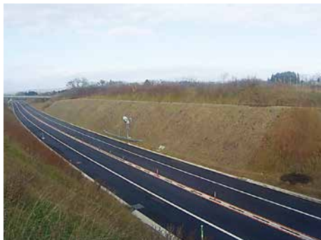
道央自動車道落部～八雲間のり面対策工事