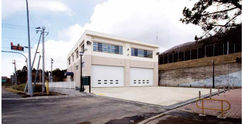
東消防署 戸井派出所（函館市小安町）