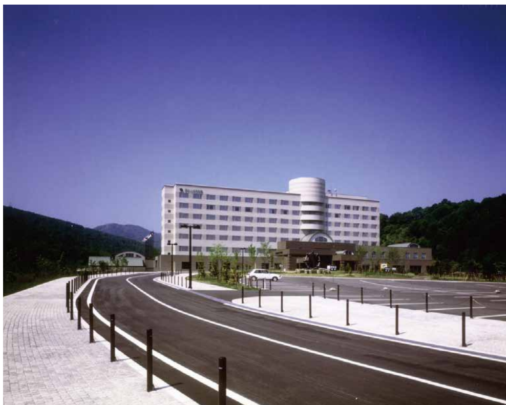
グリーンピア大沼（七飯町）