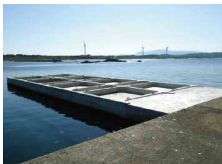
瀬棚港防波堤（東外）建設工事