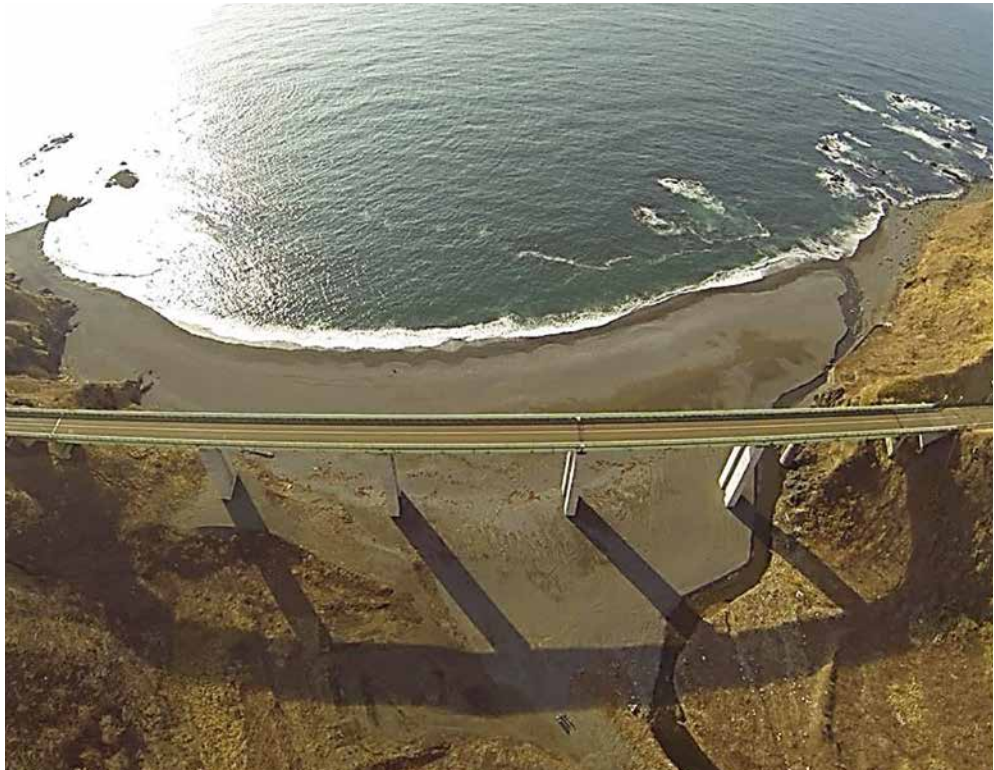
一般国道 228 号 松前町 奥末橋橋梁補修工事 ■発注者/函館開発建設部 ■所在地/松前町 ■竣工/平成27年