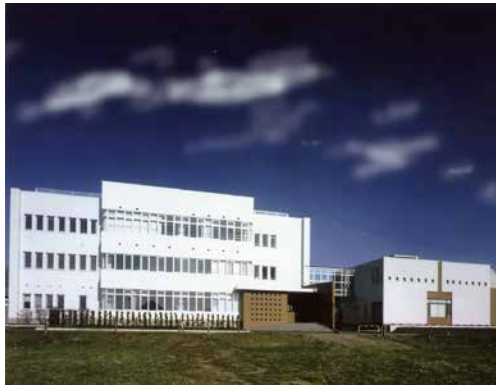
函館ラ・サール学園 第一寮・食堂棟 (函館市日吉町)