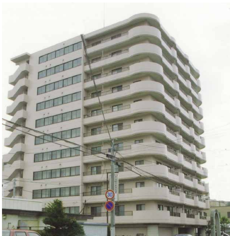
ル・フェール函館湯川