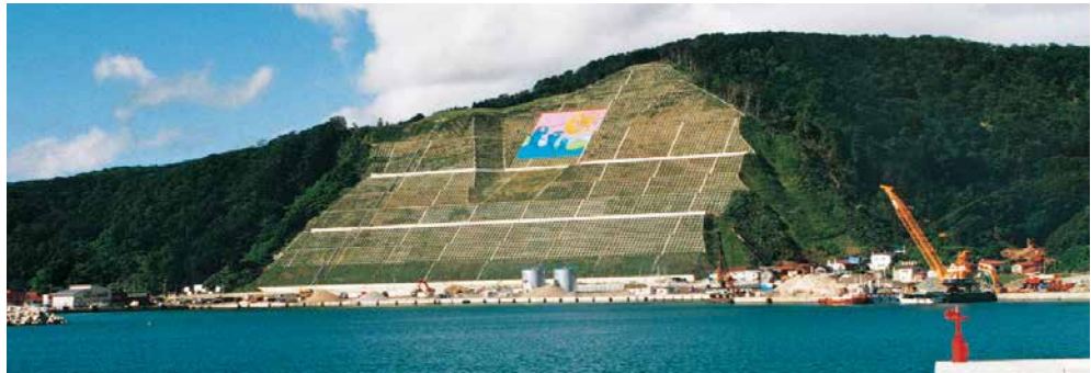
奥尻島（洋々荘裏）災害関連緊急治山工事