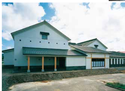
上ノ国町総合福祉センター