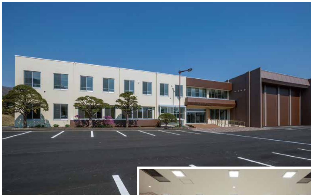
南茅部公民館（函館市川汲町）