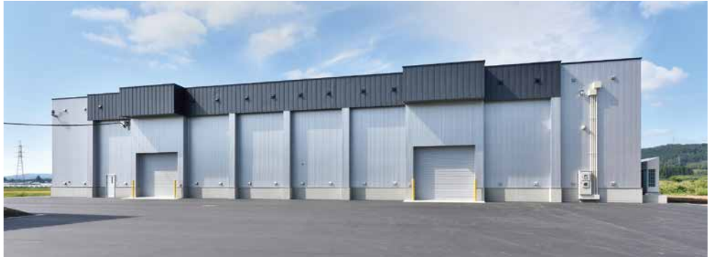
新函館農業協同組合 低温倉庫（北斗市）