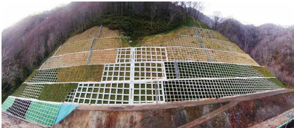
一般国道 277 号熊石町下浄瑠璃改良工事 ■発注者/函館開発建設部 ■所在地/熊石町 ■竣工/平成18年