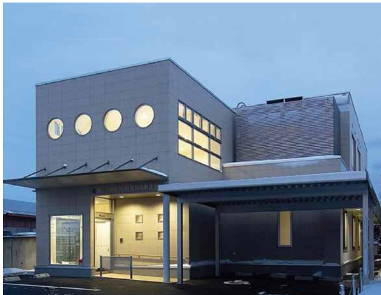
齊藤内科消化器科医院 (函館市万代町)