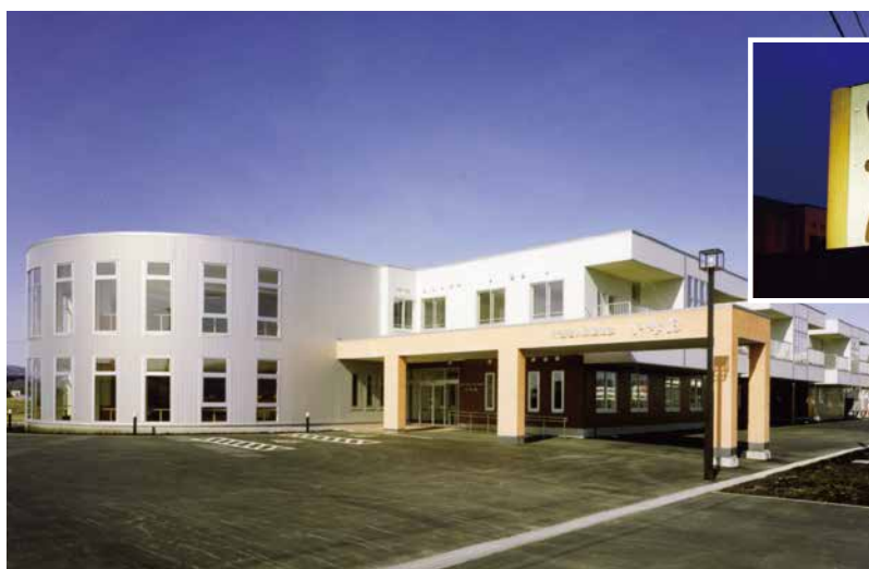
介護老人保健施設 「いなほ」(北斗市)