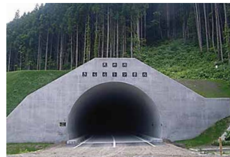
天の川きららトンネル 道道江差木古内線道路改良(早瀬トンネル)工事 ■発注者/北海道渡島支庁 ■所在地/上ノ国町 ■竣工/平成21年