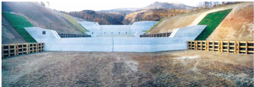
駒ヶ岳（押出の沢その2）火山地域総合治山工事