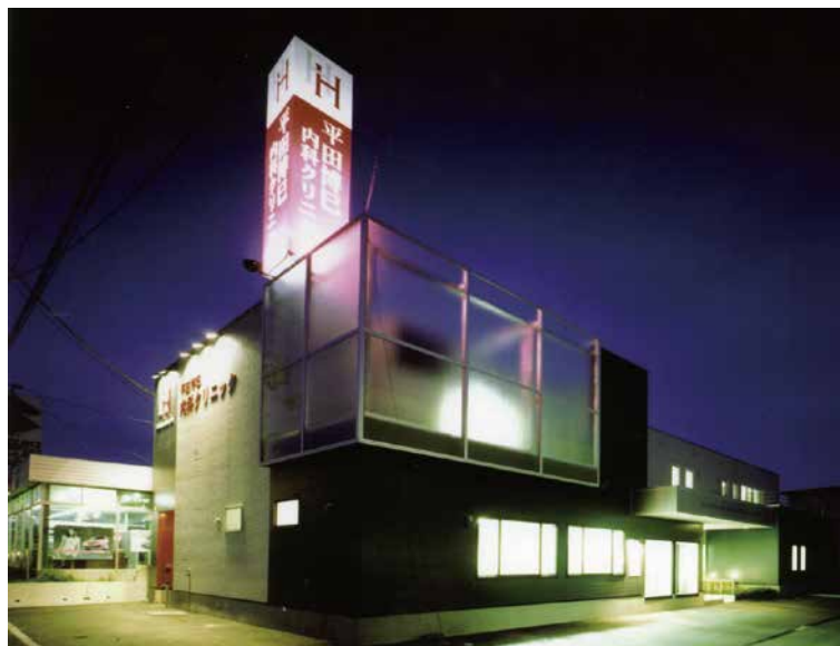
平田博巳内科クリニック (北斗市)