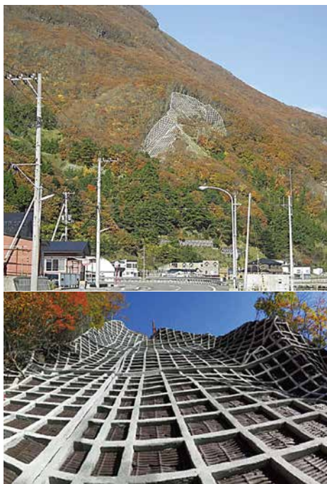
御崎地区その2 復旧治山工事 ■発注者/渡島総合振興局 ■所在地/御崎町 ■竣工/平成24年