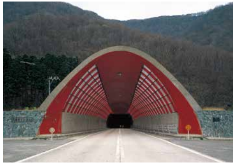
茂津多トンネル 一般国道229号せたな町茂津多トンネル工事 ■発注者/函館開発建設部 ■所在地/せたな町 ■竣工/昭和50年