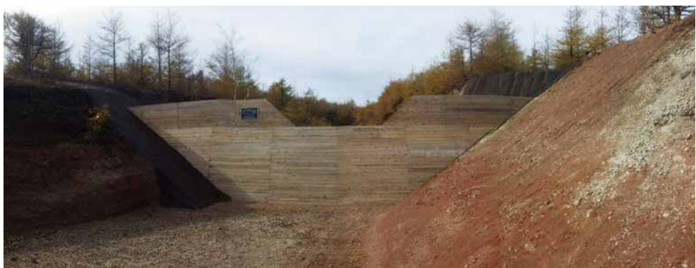
駒ヶ岳（押出Bの沢上流）地域防災対策総合治山事業 ■発注者/渡島森林管理署 ■所在地/鹿部町 ■竣工/平成28年