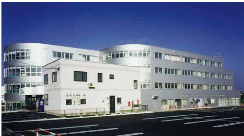
新都市函館病院（函館市石川町）