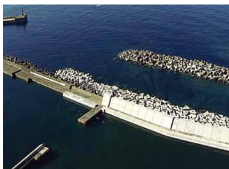
江良漁港西防波堤改良工事