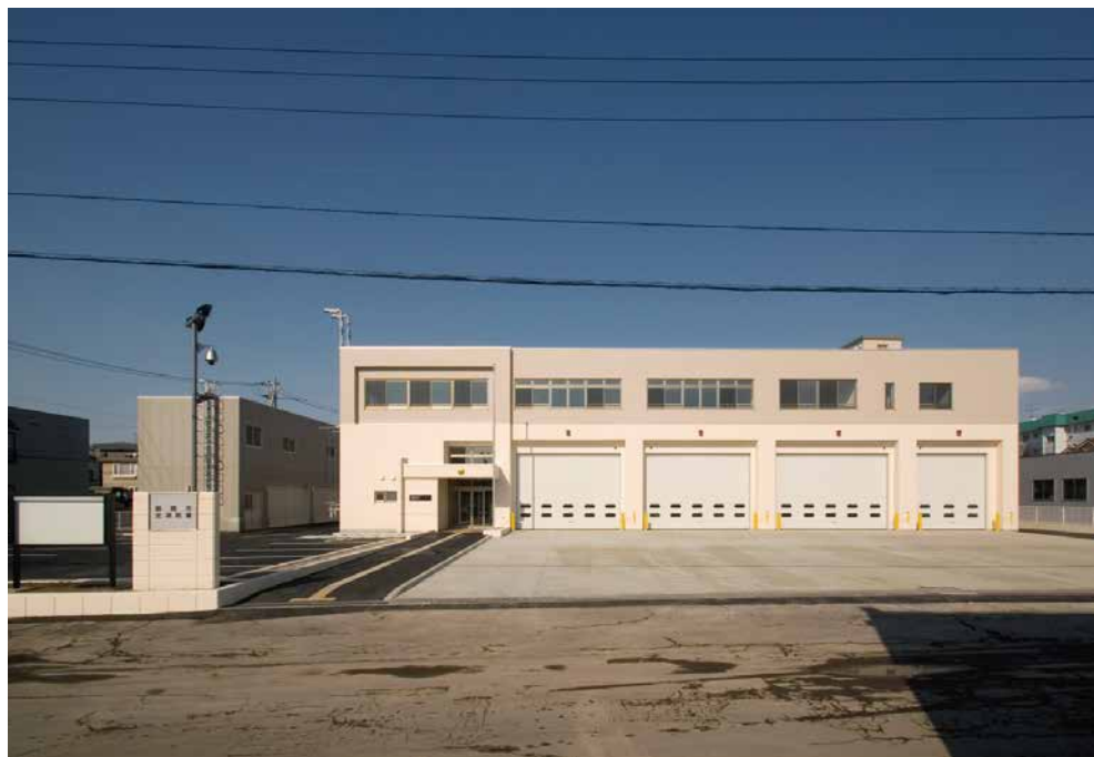
函館市北消防署 (函館市美原)

それら機能を今後とも、問題なく果たせるよう、皆様の、日々の生活に支障をきたす事の無い、公共施設をこれからも物づくりの精神に誓い、構築してまいりたいと考えております。