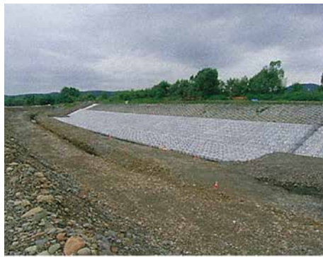
石狩川改修工事の内下比布築堤低水路保護工事 ■発注者/旭川開発建設部 ■所在地/比布町 ■竣工/平成22年