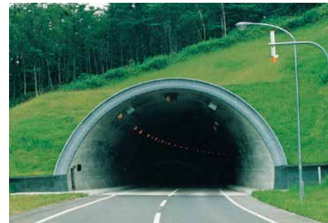
山麓トンネル 八雲厚沢部線道路改良(山麓トンネル)工事 ■発注者/北海道渡島支庁 ■所在地/八雲町厚沢部町 ■竣工/平成10年