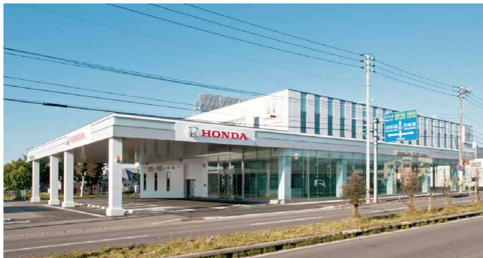
ホンダカーズ北海道本社社屋（函館市鍛冶町）