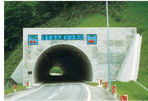
さくらんぼトンネル 八雲厚沢部線道路改良(トンネル)工事 ■発注者/北海道渡島支庁 ■所在地/八雲町 ■竣工/平成2年