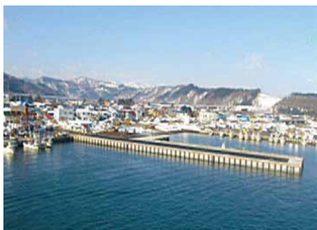
落部漁港 水産生産基盤整備工事