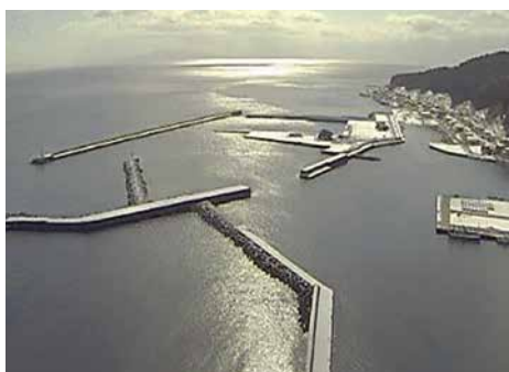
福島漁港北防波堤その他工事