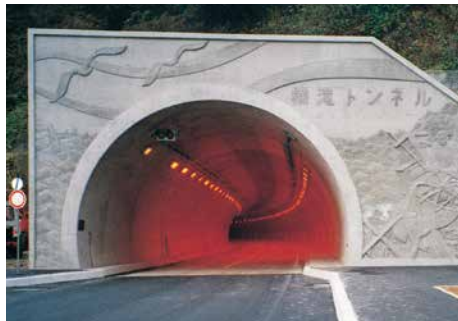
横滝トンネル 一般国道229号せたな町横滝トンネル工事 ■発注者/函館開発建設部 ■所在地/せたな町 ■竣工/平成6年