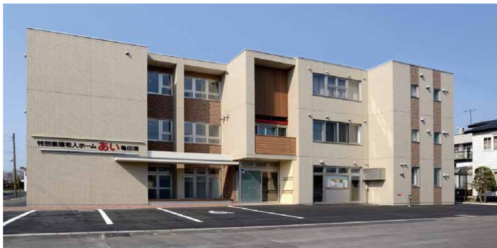
特別養護老人ホーム あい亀田港 (函館市亀田港町)