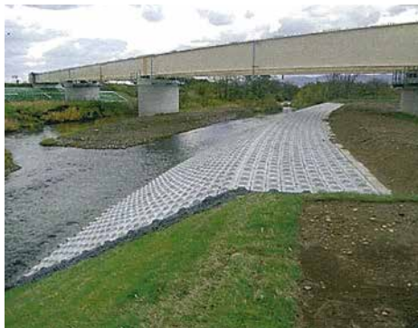
一般国道 276 号共和町前田改良外一連工事 ■発注者/小樽開発建設部 ■所在地/共和町 ■竣工/平成21年