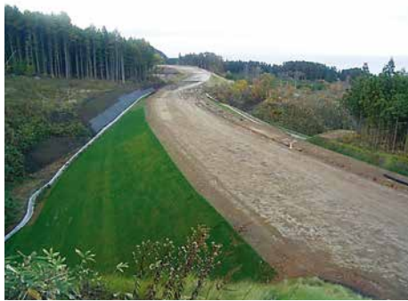
一般国道 278 号函館市臼尻改良工事