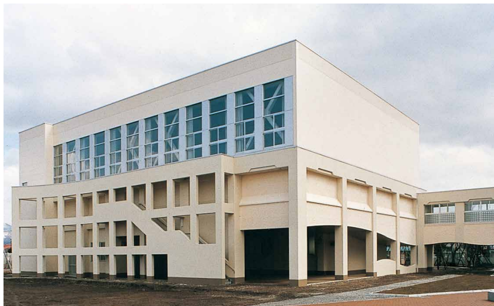
北海道函館水産高等学校 屋内体育館（北斗市）