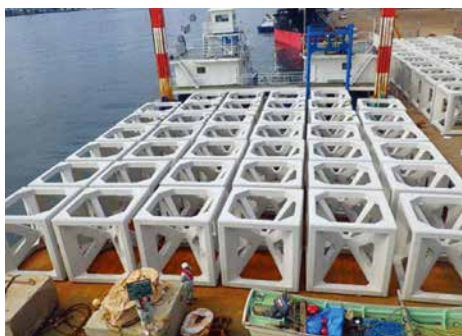
北海道津軽海峡地区函館住吉漁礁設置工事