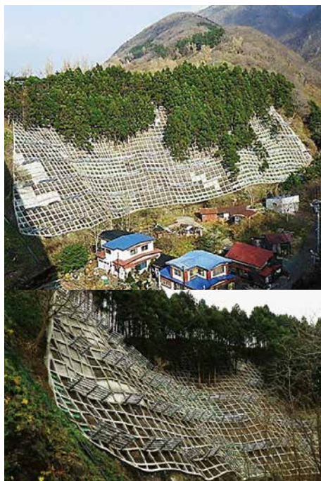
原口地区地域防災対策総合治山工事 ■発注者/渡島総合振興局 ■所在地/松前町 ■竣工/平成26年