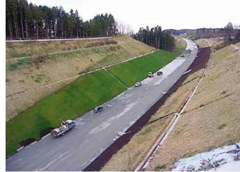
函館江差自動車道北斗市館野改良工事