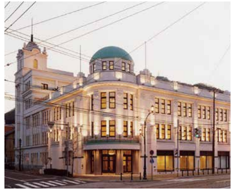
地域交流まちづくりセンター (函館市末広町)