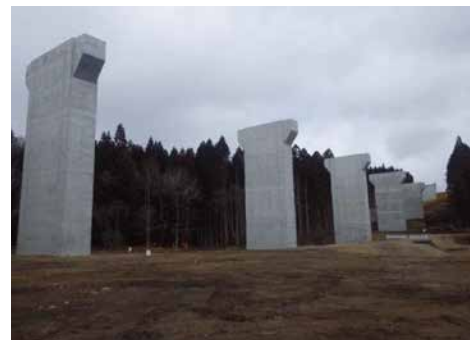
函館江差自動車道木古内町新橋呉橋下部外一連工