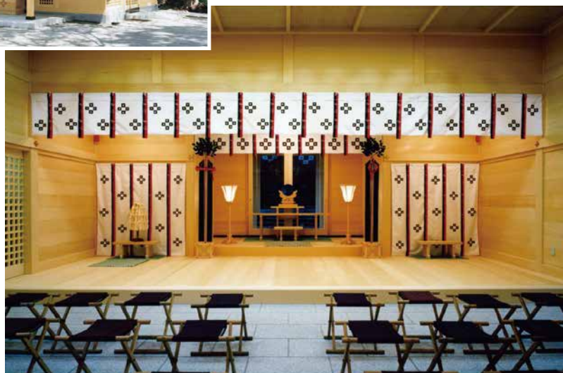
函館乃木神社拝殿 (函館市乃木町)