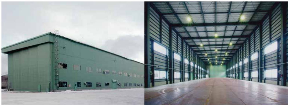
函館どつく(株)塗装工場（函館市弁天町）