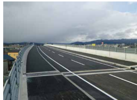
3・4・2 出雲通踏切除却工事（床版工）