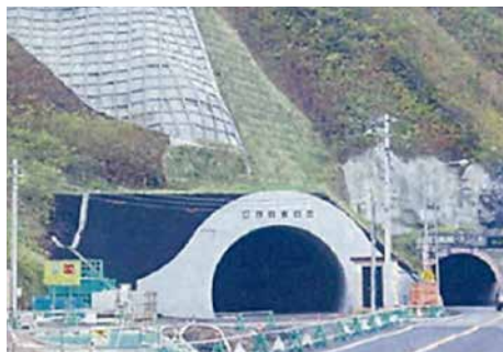
磯谷トンネル 一般国道229号蘭越町磯谷トンネル工事 ■発注者/小樽開発建設部 ■所在地/蘭越町 ■竣工/平成17年